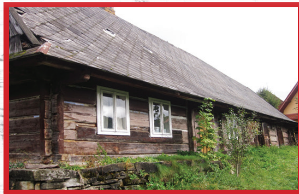
Chata w stanie aktualnym

Jednym z pierwszych zadań, które postawiliśmy przed sobą jest odnowienie zabytkowej chyży w Komańczy i przekształcenie jej w centrum kultury łemkowskiej.